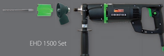
EHD 1500 Set