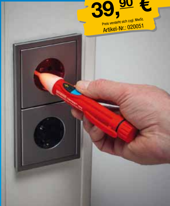
Phasenprüfung an Schutzkontaktsteckdosen und Abzweigdosen.

Preis versteht sich zzgl. MwSt. Artikel-Nr.: 020051