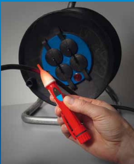
Auffinden von Kabelbrüchen an isolierten und unter Spannung stehenden Leitungen