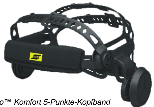
Halo™ Komfort 5-Punkte-Kopfband (Vorderansicht)

Weitere Informationen erhalten Sie auf esab.de